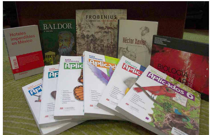
Libros reconocidos con el Premio al Arte Editorial 2017.

Hoteles imperdibles en México (Travesía Editores, S.A. de C.V.). Los cinco hoteles elegidos para formar parte de este libro tienen solamente una cosa en común: mucha personalidad. Ya sean grandes resort o pequeños hoteles boutique, ya sean casonas restauradas o lodges en medio de la selva o mirando al mar, cada uno tiene un carácter propio. Éstas son las 50 excusas que necesitas para descubrir otras caras de México.