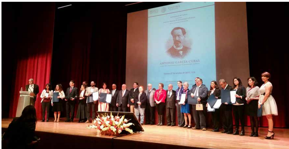
Foto grupal de los galardonados con el Premio Antonio García Cubas.

El galardón que el instituto entrega anualmente al mejor libro y labor editorial, evoca al destacado escritor y geógrafo Antonio García Cubas (1832-1912), quien con sus obras trató de unir en el siglo XIX la historia, la población y el territorio nacional.