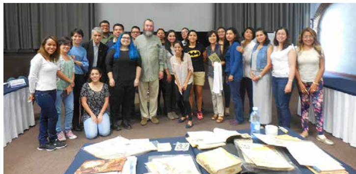
Parte de los participantes de la Beca Juan Grijalbo en su edición xxviii.

Este seminario intensivo de 40 horas fue convocado por la Cámara Nacional de la Industria Editorial Mexicana, a través de su Centro de Capacitación, siendo los cinco grandes temas tratados: “Edición y editores”, “Procesos