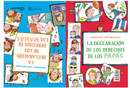
Portada de La declaración de los derechos de las mamás y la declaración de los derechos de los papás , de Ediciones Tecolote -Secretaría de Cultura

La Edición Facsimilar premiada fue Gabinetto armónico de Fillippo Bonanni , de Marcello Piras