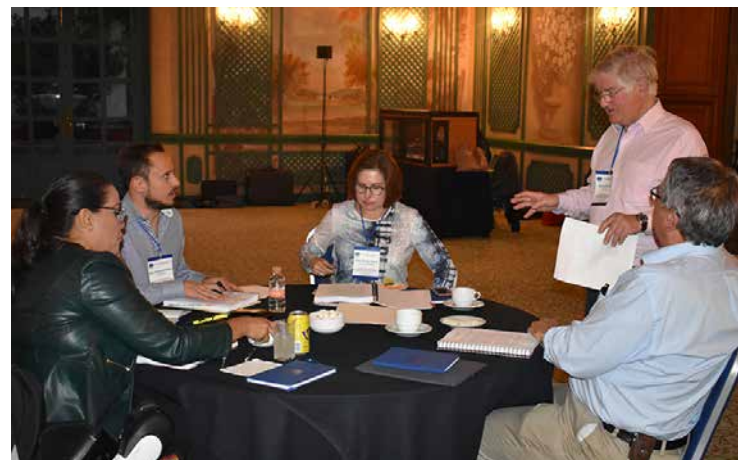
Con gran entusiasmo, los participantes comienzan este seminario intensivo de cuatro días.