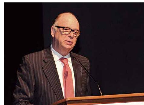
Enrique Krauze Kleinbort.

Nació en la Ciudad de México en 1947. Es ingeniero industrial por la Universidad Nacional Autónoma de México. Obtuvo el doctorado en Historia por el Centro de Estudios Históricos del Colegio de México. En 1992 fundó y dirigió la Editorial Clío, y en 1999 crea y dirige la revista Letras Libres . Ha sido condecorado por numerosas universidades y es autor de un sinnúmero de ensayos, biografías y análisis políticos e históricos.